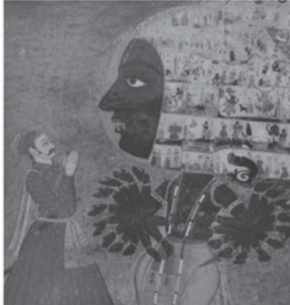
चित्र सं. 2

राजस्थानी चित्रों का आधार ही संगीत युक्त, प्रतीक युक्त, संस्कारों में नैतिक उपादानों को स्पष्ट करता है। राग-रागिनी चित्रों में रागों के आधार पर चित्रण या ऋतु वर्णन में पात्रों का ऋतु के अनुकूल मनःस्थिति इत्यादि लाक्षणिक वृत्तियाँ अतिकल्पना के रूप में अंकित हुई हैं या फिर उन चित्रों का संकलन जिनका सम्बन्ध तंत्र से है। वैज्ञानिकतत्व, अनुष्ठानिक, कर्मकाण्ड और धार्मिक संस्कारों को यन्त्र, प्रतीक जैसे सृजन स्वरूपों का अतिकल्पनात्मक रूपान्तरण इन लघुचित्रों में हुआ है। 6 कल्पना से कल्पनातीत रूप में विश्वस्वरूप दर्शन जैसे लघुचित्र में ईश्वर को व्यापक कला अभिप्रायों से सुसज्जित किया जिससे ईश्वर की देवीय सत्ता इस भूलोक के जनसामान्य तक पहुँच सके। जब देवता का चित्रण किया जाता है तो देवीय वृत्तियाँ जिसमें सहस्र हाथ, आभायुक्त मुखमण्डल है और विश्व स्वरूप की बात हो तो अधिक से अधिक स्वरूपों को एक साथ एक चित्र में अभिव्यक्त करने की चेष्टा कलाकार करता है, जिससे समाज में धर्म के माध्यम से रहस्यात्मक सत्य को मूल्यों के रूप में व्यक्ति आत्मसात कर सके।